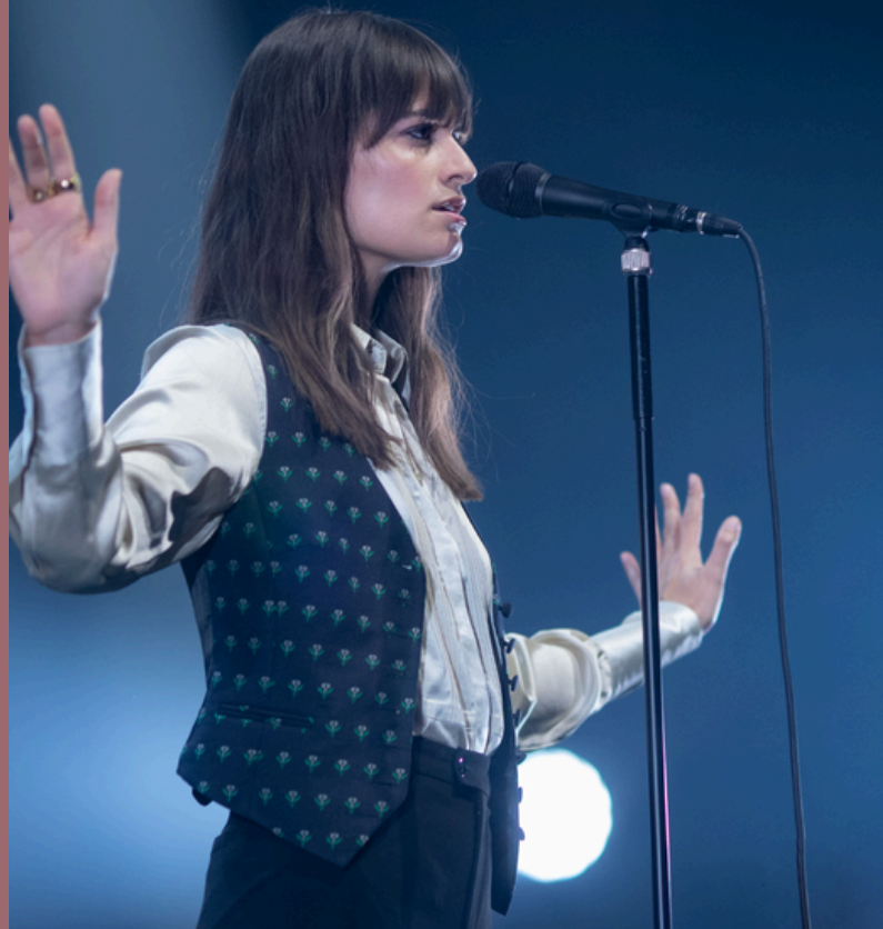
Clara Luciani à l'Olympia P.6