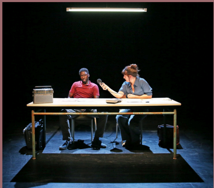
Mon pays, ma peau avec Romane Bohringer P.5