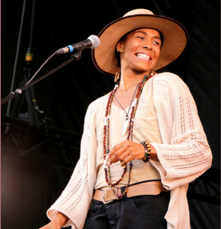
AYO à l'Olympia P.6